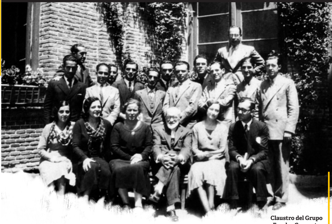
Claustro del Grupo Escolar Cervantes en la etapa republicana.