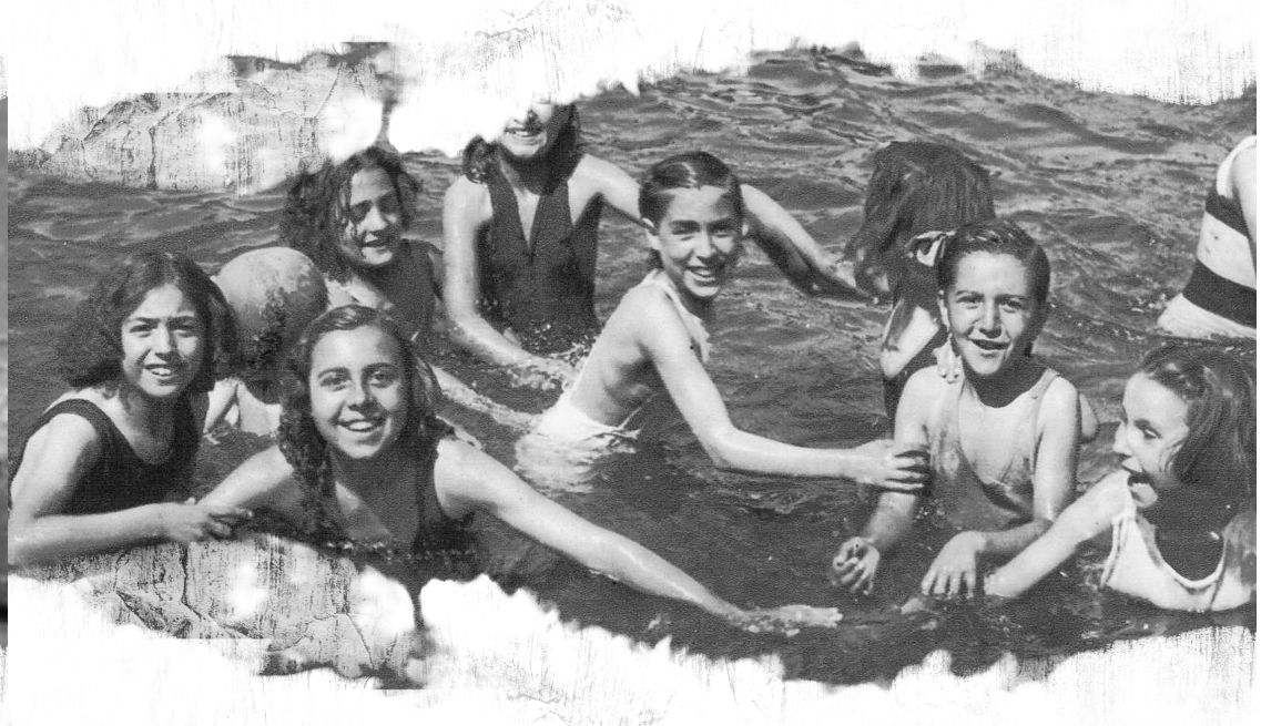
Grupo Escolar Lope de Vega.

Así van apareciendo los gabinetes médicos, los espacios para baños y duchas y las piscinas que se convirtieron en un espacio fundamental en todos los diseños arquitectónicos de la etapa republicana.