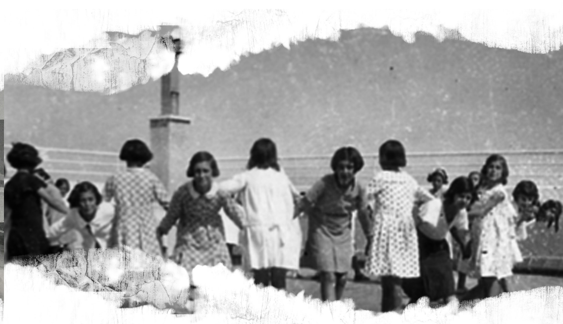
Grupo Escolar Alfredo Calderón (entre 1933 y 1935).

En Madrid, todas las nuevas construcciones escolares tuvieron patios , en los que se realizaban los juegos y los ejercicios físicos. También se acondicionaron las azoteas para el esparcimiento de los niños y niñas; así como para clases al aire libre. Y las galerías y zonas de paso se habilitaron como espacios de actividad libre.