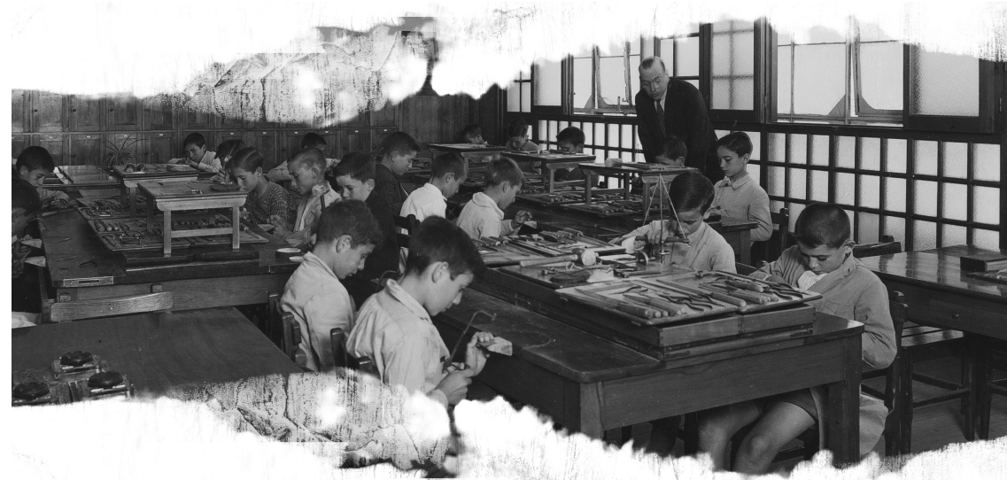
Clase de trabajos manuales en el Grupo Escolar Cervantes, 1933.

Este ideal de la educación integral implicó la aparición de otros usos del espacio escolar desconocidos hasta este momento. La nueva organización del currículum marcó tiempos para el recreo y los juegos infantiles, y así surgieron los patios. Aparecieron otros espacios y, sobre todo, se crearon los comedores escolares, que transformaron la imagen que de la escuela pública tenían las familias y la sociedad.