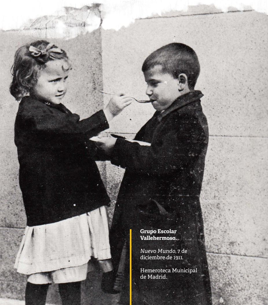
Grupo Escolar Vallehermoso.

Ante el "desastre" de 1898 muchos regeneracionistas se dejaron llevar por el pesimismo y pensaron que esta crisis significaba el fin de la nación. Pero otros aportaron soluciones. La mayoría apuntó a la educación como una de las vías para salvar a España, creyeron en su papel como motor de cambio social. Y soñaron con una escuela primaria que transformaría la "España vieja" en la "España nueva". Así se inició el proceso de reforma pedagógica más intenso que se ha vivido en nuestro país.